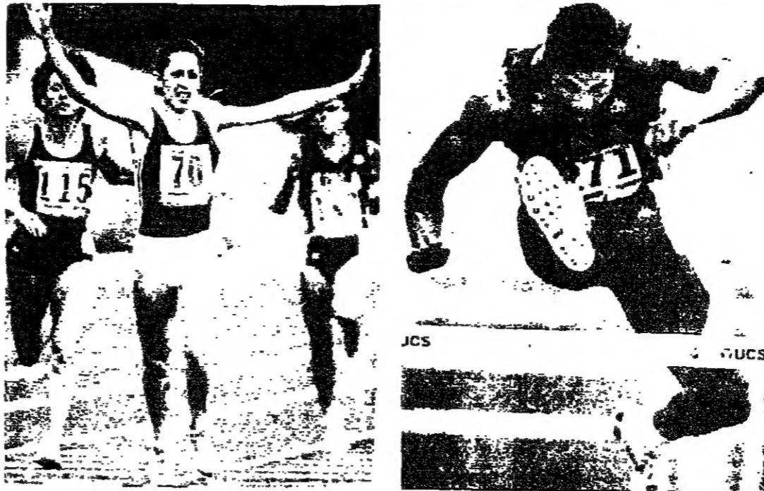
الاميركي دان اوبراين في سباق ١١٠٠ متر حواجز ضمن مسابقة العشارية (روبيرت)